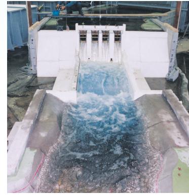
水理模型実験 (電力中央研究所保有設備)