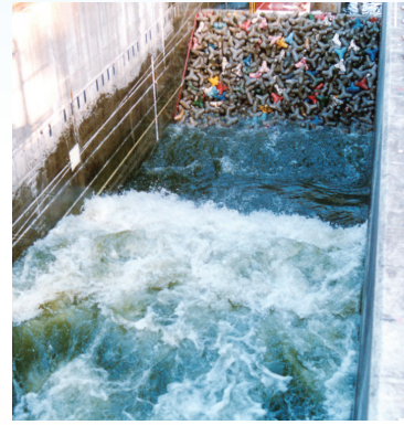
造波実験 (電力中央研究所保有設備)