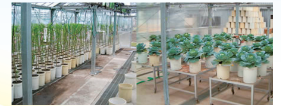
野菜・樹木の栽培試験 (電力中央研究所保有設備)