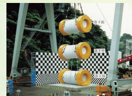
実機構造物の健全性実証試験