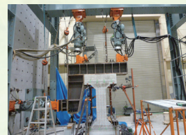
水路構造物の荷重試験 (電力中央研究所保有設備)