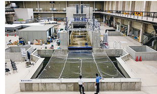
津波・氾濫流実験 (電力中央研究所保有設備)