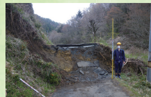
地表地震断層調査

発電所および原子力関連施設の健全性や原子力リスクに係る評価を支援するために、各種材料の物性評価試験や現地調査、実機構造物による実証試験を行っています。